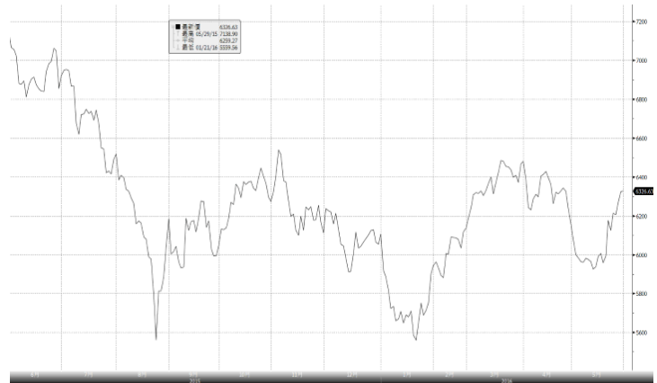
資料來源: 彭博 期間: 2015年5月29日至2016年5月31日